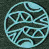
символ з'єднаних світів