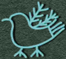
символ нових звісток

Чи знаєш, що... у давнину кожен клан мав свій власний, неповторний тотем? Найчастіше це була дерев'яна фігурка або малюнок тварини, рослини чи предмету, який вважався уособленням міфічного предка та опікуна даного покоління. Такий тотем шанувався і становив один з символів приналежності до певного роду.