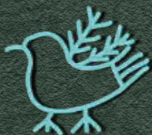
symbol nowych wiadomości

Czy wiesz, że... w dawnych czasach każdy klan miał swój własny, niepowtarzalny totem? Totemem była najczęściej drewniana rzeźba lub rysunek wybranego zwierzęcia, rośliny lub przedmiotu, uznawanego za uosobienie mitycznego przodka i opiekuna danej rodziny. Totem był otaczany czcią i stanowił jeden z symboli przynależności do danego rodu.