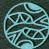
symbol połączonych światów